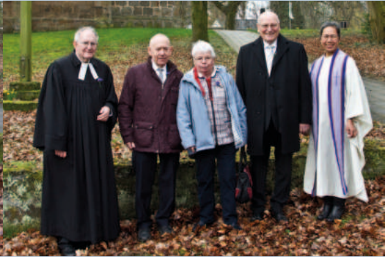
Konfi-Jahrgang 1958 Eisern (65 Jahre)