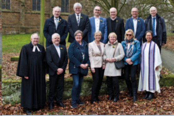
Konfi-Jahrgang 1973 Golden (50 Jahre)