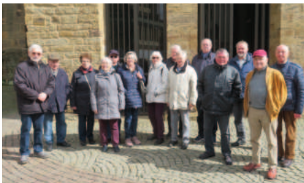
14 Gruppe vor dem „Paradies“

Der Mindener Dom liegt quasi vor der Haustür, aber viele haben ihn nicht von innen gesehen. So kam der Gedanke auf, ihn und den Domschatz zu besuchen, natürlich mit einer Führung, denn, was man nicht erklärt bekommt, sieht man auch nicht. So starteten wir am 28. März mit 15 Personen zur Besichtigung. Die Sonne schien, der Wind wehte eiskalt um den Dom. Ein Führer wies uns auf die unterschiedlichen Bauabschnitte des Domes hin, zuerst von außen, dann später von innen. Unter der Erklärung unseres Führers begannen die mächtigen Maßfenster in ihrer Symbolik zu sprechen, Steinplastiken aus dem 13. Jahrhundert bekamen Gesichter, obwohl sie äußerlich verwittert waren. Das Bronzerelief der Stadt im 13. Jahrhundert vor dem Dom zeigte uns das Domgebiet, die Freiheit und als Gegenüber die Bürgerstadt mit dem Rathaus dicht an die Domfreiheit grenzend. Die Geschichte der Stadt wurde erzählt. Das romanische Westwerk und der ursprünglich romanische Chor war durch ein romanisches Langhaus verbunden, das dann in der Gotik zur Hallenkirche umgebaut wurde. Eine der Kostbarkeiten war die Skulptur mit der Emerenzia,