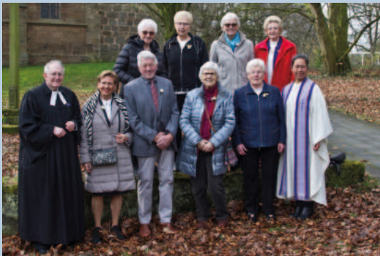
Konfi-Jahrgang 1953 Gnaden (70 Jahre)