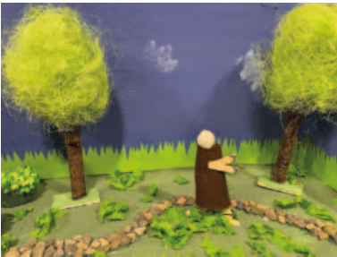
3. Jesus betet im Garten Gethsemane