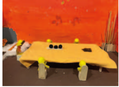
2. Das letzte Abendmahl