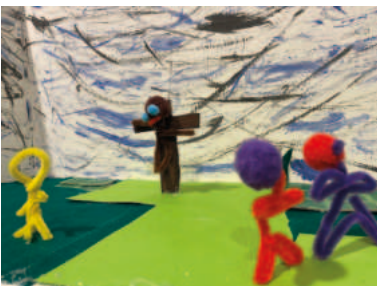
6. Jesus wird gekreuzigt