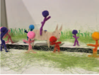
1. Einzug in Jerusalem