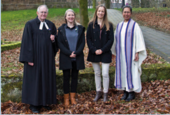
Konfi-Jahrgang 1998 Silber (25 Jahre)