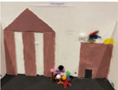
5. Petrus verleugnet Jesus