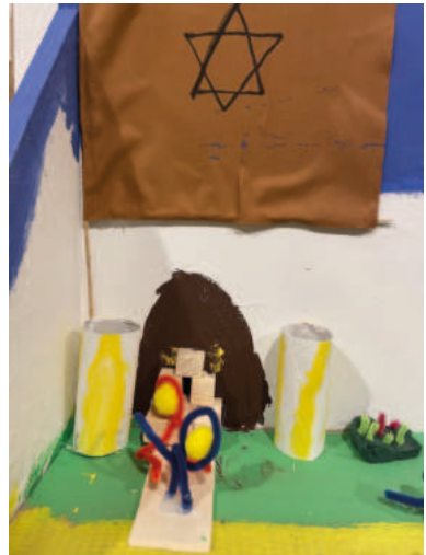
4. Jesus vor dem jüdischen Rat