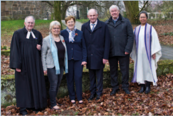
Konfi-Jahrgang 1963 Diamanten (60 Jahre)