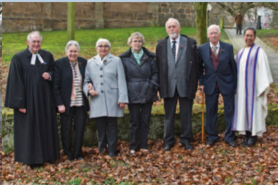
Konfi-Jahrgang 1948 Kronen (75 Jahre)